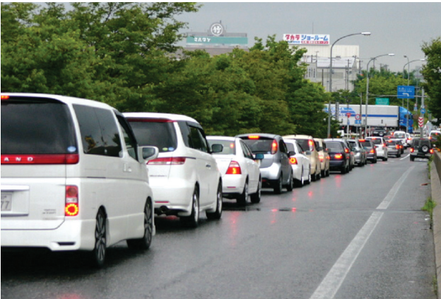
写真：小新IC周辺の渋滞の様子

本取り組みを通し、流通センターの皆様はその行動と効果を経験していただくことで、その有効性を検証し、対策継続のための課題を把握します。